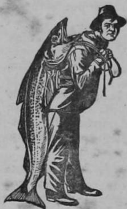
Marca de la Emulsión legítima.

necesitan la Emulsión de Scott , que más que un medicamento es un poderoso alimento