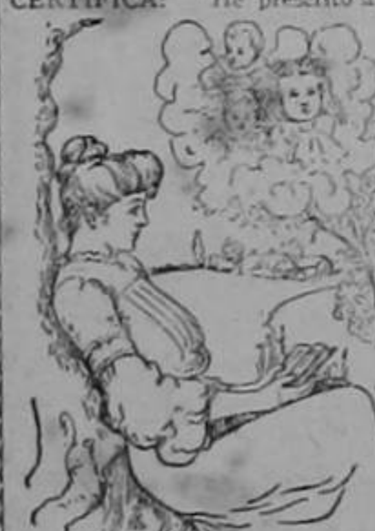
(Para la señora q. está entristecida porque le parece imposible ser madre.)

El Dr. H. R. Euen de la Facultad de Medicina de Paris, de Port-au-Prince, Rep. de Haití, CERTIFICA: "He prescrito a mis enfermas el Compuesto Mitchellia habiendo obtenido admirables resultados en los siguientes casos: Para calmar los dolores frecuentes durante el embarazo y el parto, flores blancas, menstruación dolorosa y como tónico reconstituyente. Lo recomiendo a las señoras y señoritas que sufren de iguales dolencias."