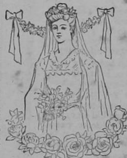
(Para las señoras débiles, nerviosas o demacradas.)