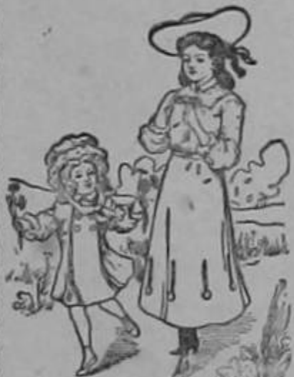
(Para las niñas q. comienzan a entrar en el estado de mujer)