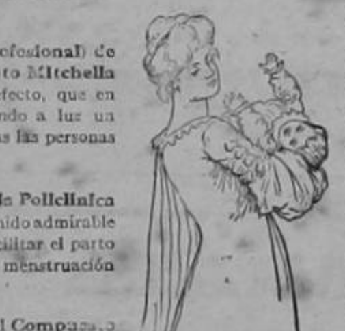
(Para la señora embarazada y para la madre q. está criando.)